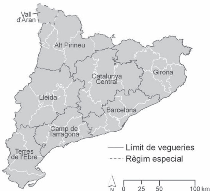
Figura 1. L'organització territorial en vegueries del 3/8/2010

Autor: Laboratori de Cartografia i SIG, Departament de Geografia, Universitat Rovira i Virgili